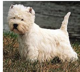
WEST HIGHLAND TERRIER